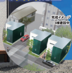
完成イメージ 3棟建設中