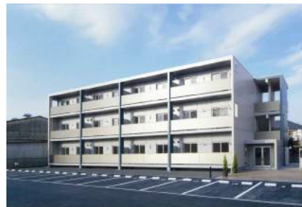
駐車場2台無料(縦列)