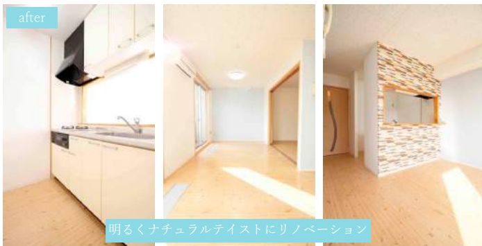
明るくナチュラルテイストにリノベーション

築10年を迎え細かな修繕箇所も目立つよう になりました。 今回は、より永くお住まいいただけるように 全面的なリノベーション工事を実施。 明るく清潔感ある空間を創り出しました。